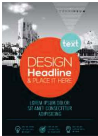
Página 01 (Frente)

Veja o modelo abaixo para montagem do seu arquivo: