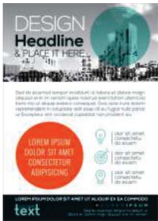
Página 02 (Verso)

Panfletos 4x0 devem ser enviadas apenas com 1 página contendo a frente do serviço/impressão. O verso deste material não será impresso.