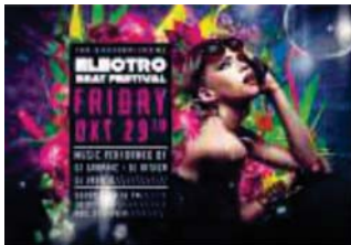
Página 01 (Frente)