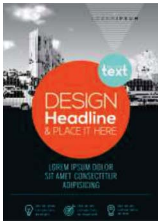
Página 01 (Frente)