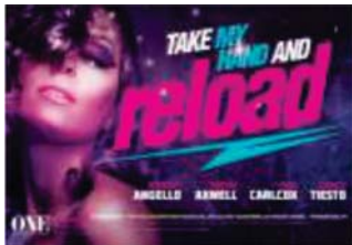
Página 02 (Verso)

Panfletos 4x0 devem ser enviadas apenas com 1 página contendo a frente do serviço/impressão. O verso deste material não será impresso.