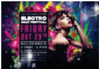
Página 01 (Frente)

Veja o modelo abaixo para montagem do seu arquivo: